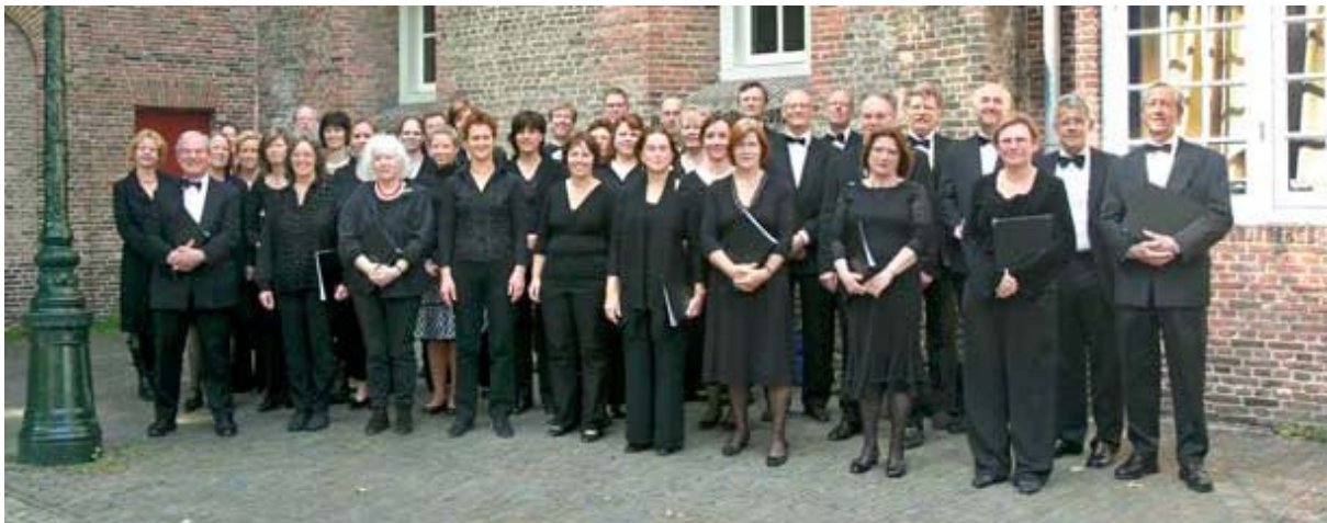
Leiden English Choir ( www.lec.nl )